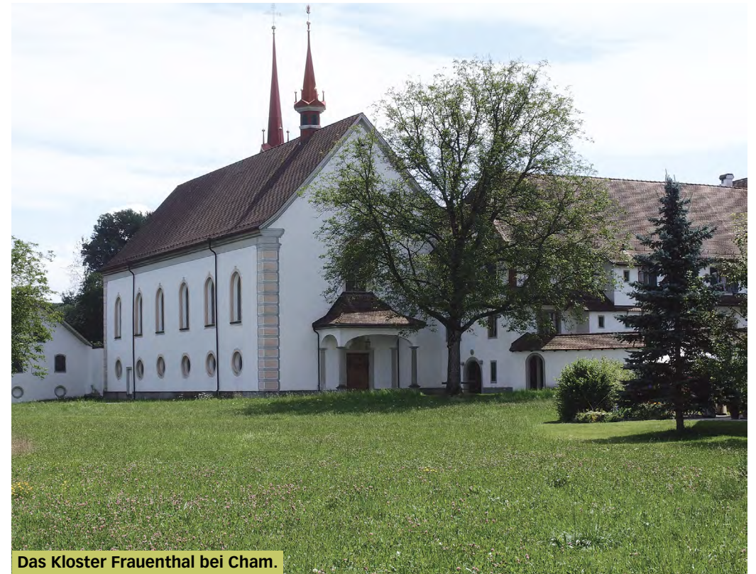
Das Kloster Frauenthal bei Cham.