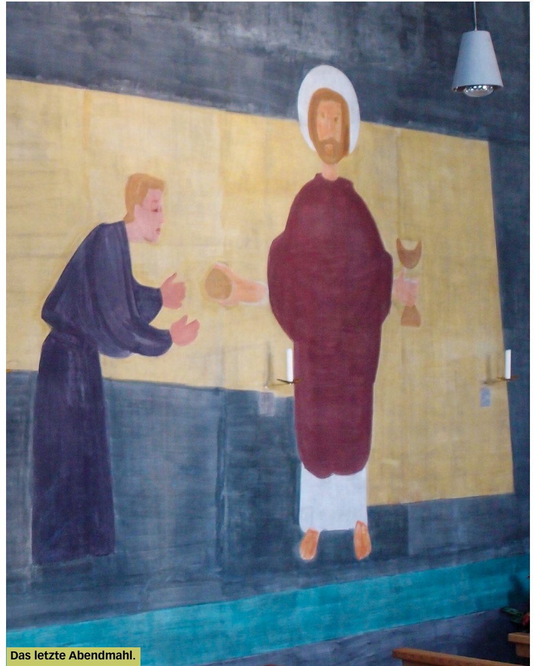
Das letzte Abendmahl.