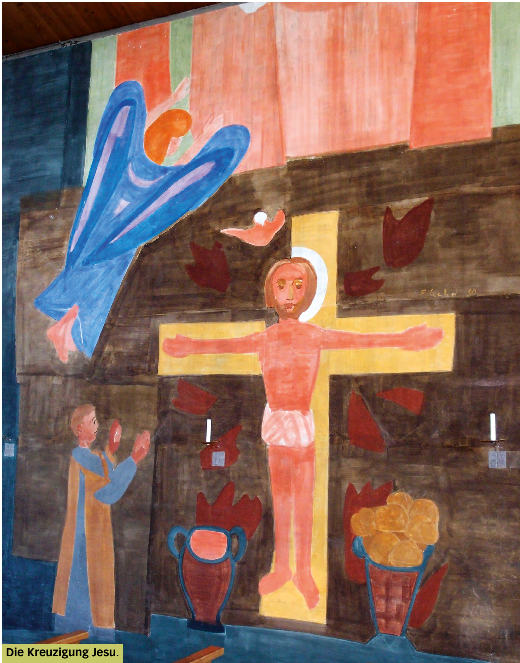
Die Kreuzigung Jesu.