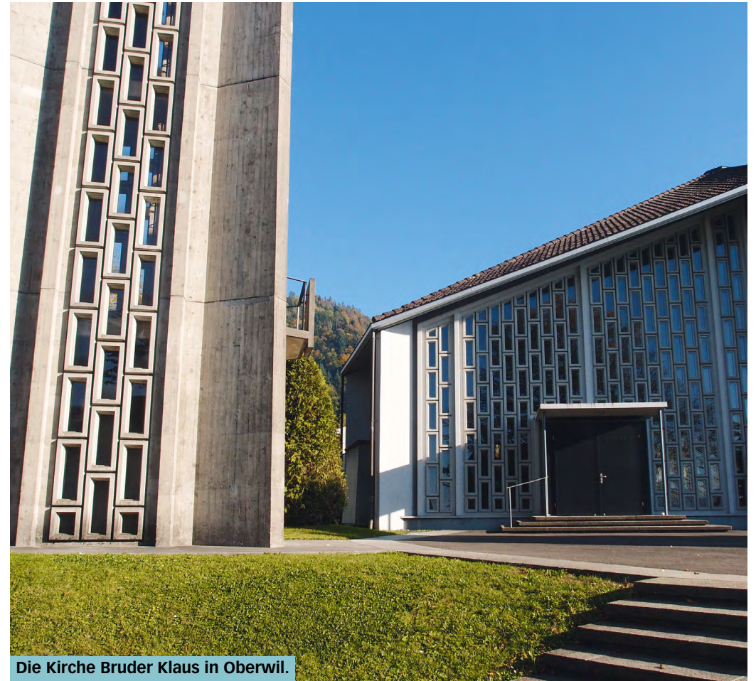
Die Kirche Bruder Klaus in Oberwil.