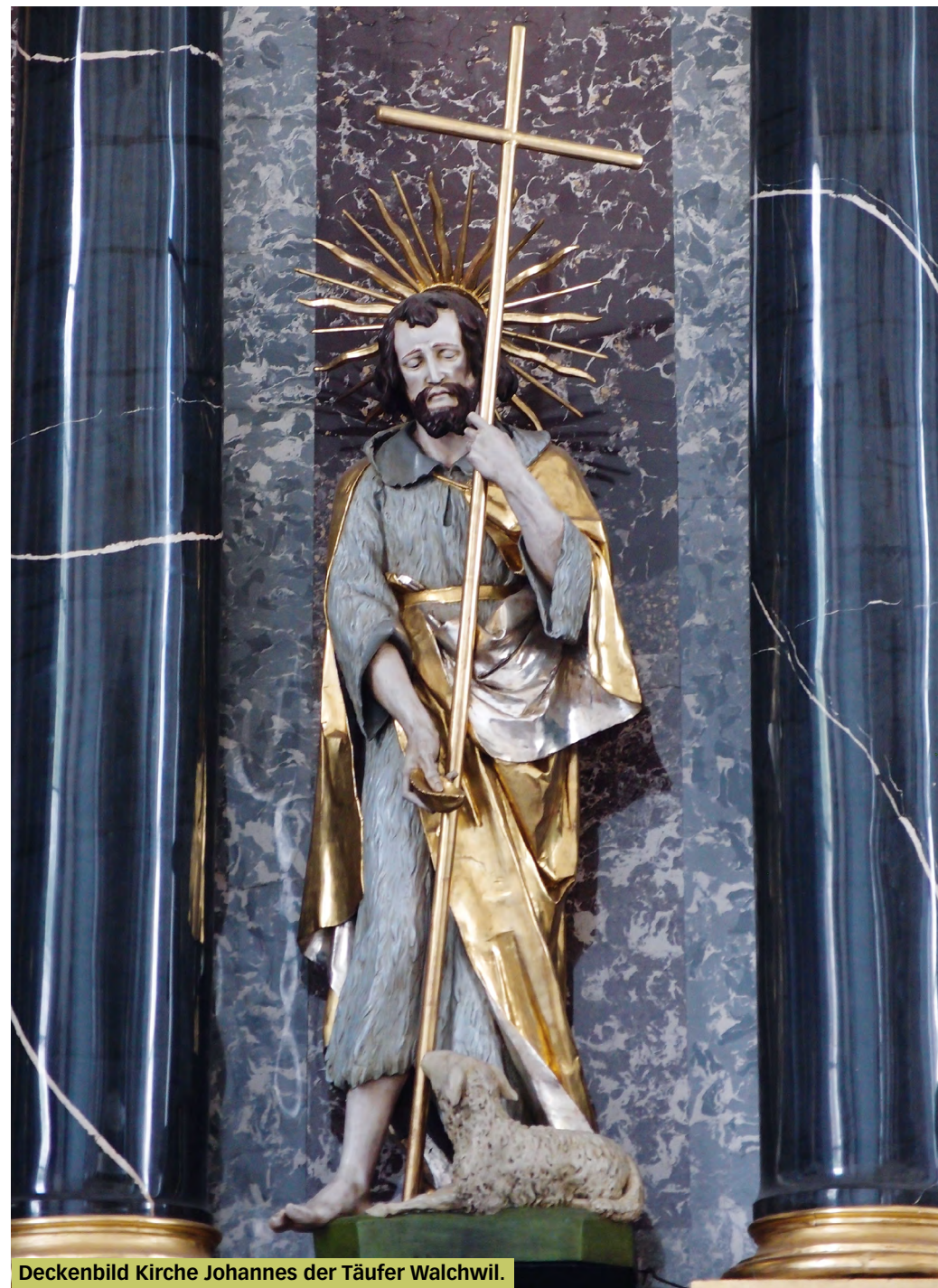
Deckenbild Kirche Johannes der Täufer Walchwil.