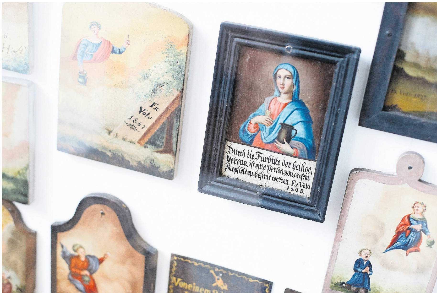
Zahlreiche Votivtafeln in der St.-Verena-Kapelle zeugen von der ausgeprägten katholischen Volksfrömmigkeit im 18. und 19. Jahrhundert. Die Bilder sind hauptsächlich für Erhörungen durch die heilige Verena gestiftet worden. Bild: Stefan Kaiser (Zug, 26. Februar 2018)

Ein besonders schönes Beispiel eines Votivschatzes im Kanton Zug ist in der Verenakapelle oberhalb der Stadt Zug anzutreffen. An den rückseitigen Wänden der beiden Seitenschiffe/-kapellen hängen zahlreiche Votivtafeln, vornehmlich aus dem 18. und 19. Jahrhundert. Hinter jeder einzelnen von ihnen steht ein Ereignis, welches der Stifter oder die Stifterin der hl. Verena zugeschrieben hat. Viele der bemalten Tafeln zeigen die Patronin der Armen und Notleidenden mit ihrem Hauptattribut, dem Krug. Manche Tafeln sind lediglich mit «ex voto» und einer Jahreszahl beschriftet.