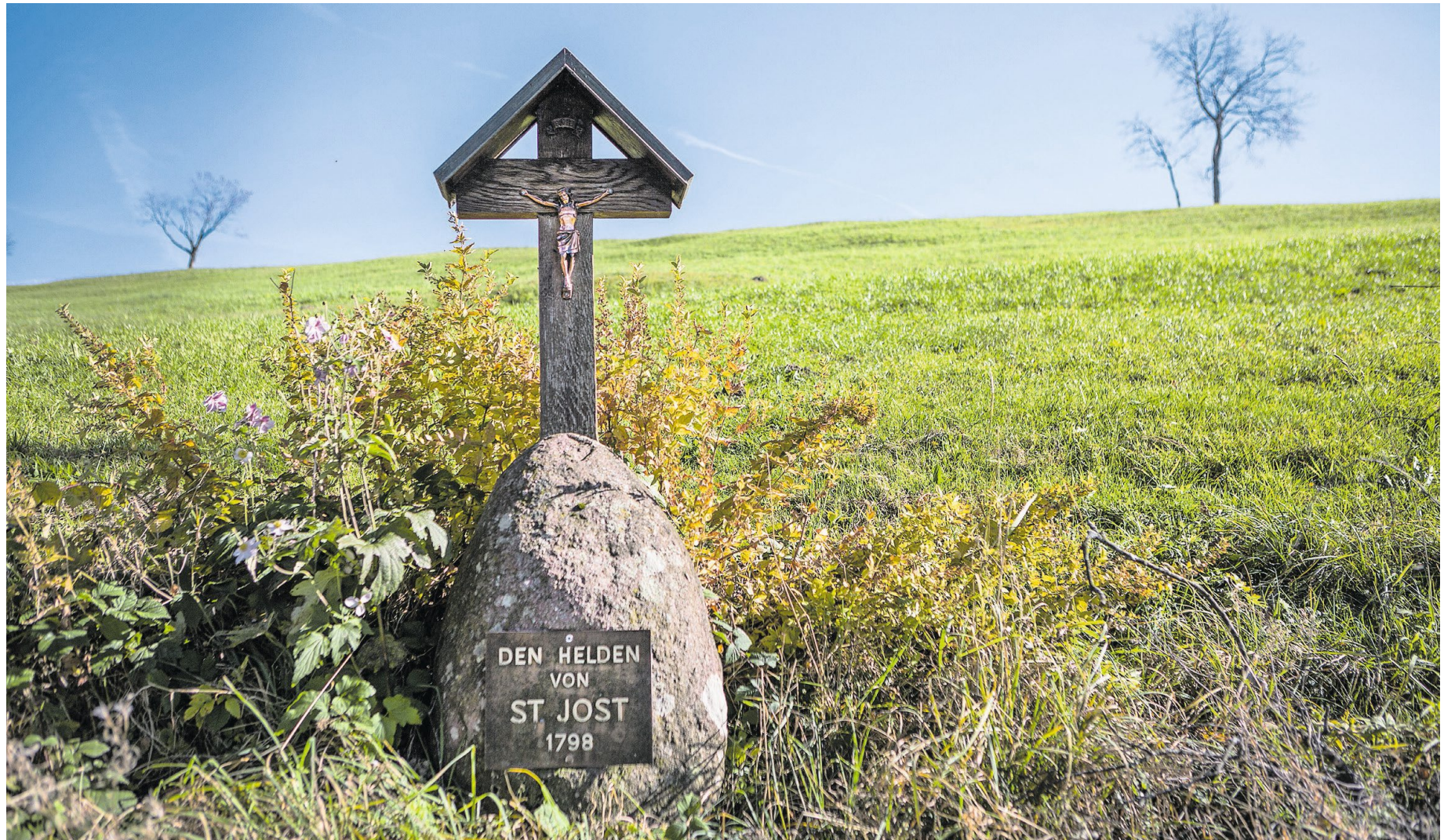
Der Stein mit dem hölzernen Kruzifix am St.-Jost-Rain erinnert an die Ägerer, die sich 1798 gegen die französischen Truppen gestellt haben. Bild: Patrick Hürlimann (Alosen, 13. Oktober 2017)

Das stark Einfluss ausübende Frankreich jedoch strebte eine einheitliche Republik nach französischem Vorbild an. Die neue helvetische Verfassung von 1798 entsprach diesem Wunschbild, wurde jedoch vor allem von konservativ gesinnter Seite energisch abgelehnt, auch von den Zugern. Frankreich wollte intervenieren, sandte Truppen in die Schweiz, worauf die sogenannte Helve-